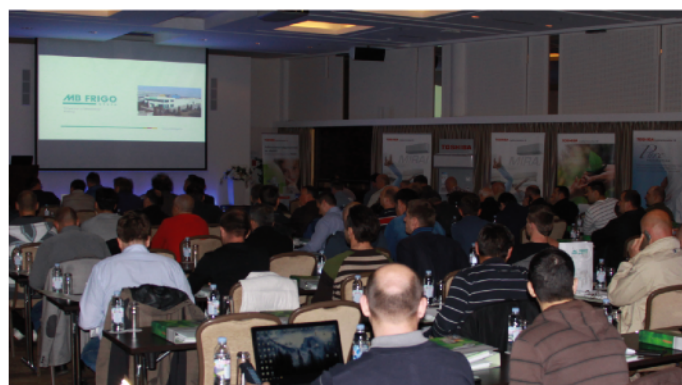
Trening i edukativni seminari