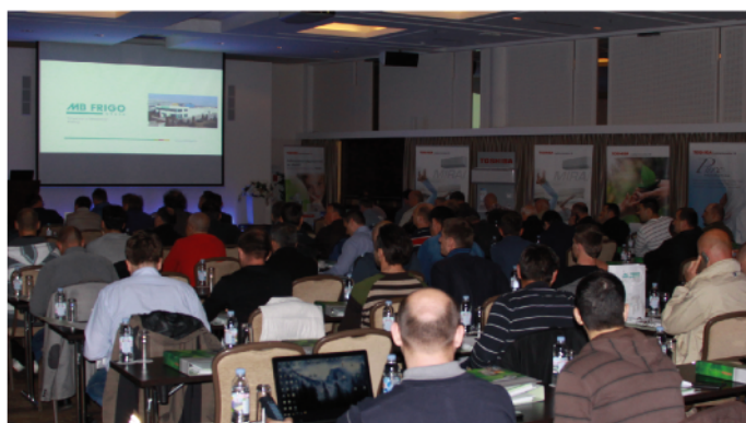
Trening i izobraževalni seminarji