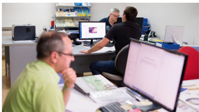
Svetovanje in inženiring

Na teh seminarjih vam MB Frigo Skupina ponuja celotno podporo za blagovno znamko Maxon.